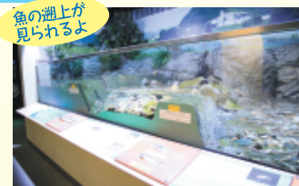
魚の遊上が見られるよ