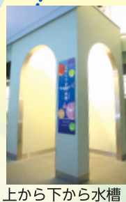
上から下から水槽