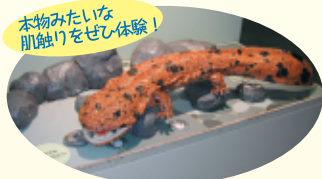
オオサンショウウオのレプリカ