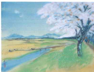
大野麥風「岐蘇路六十九次」(63熊谷)1912年