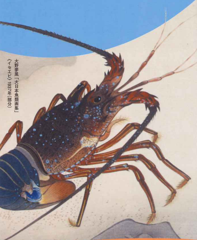
大野夢風「大日本魚類画集」 (マダイ) 1937年(部分)