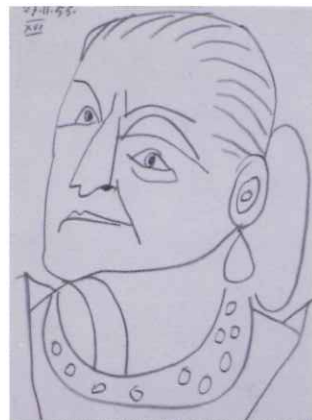
パブロ・ピカソ「ヘレナ・ルビンスタインの肖像」より1955年(後期展示予定)