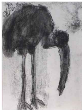
中村忠二「忠二動物エンピツデッサン篇」(禿げカ)1958年(後期展示予定)