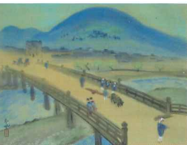
大野麥風「岐蘇路六十九次」(1912年)