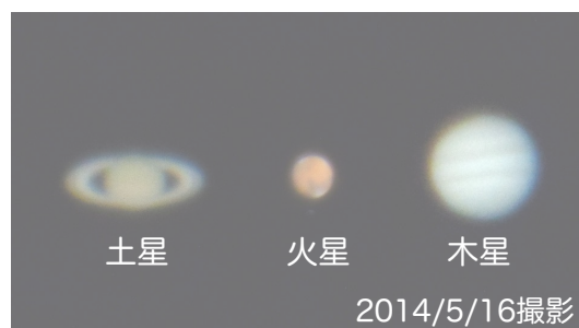
写真2 望遠鏡で見た3惑星 13cm反射望遠鏡+PL12mm接眼レンズ で拡大撮影したものを並べた。