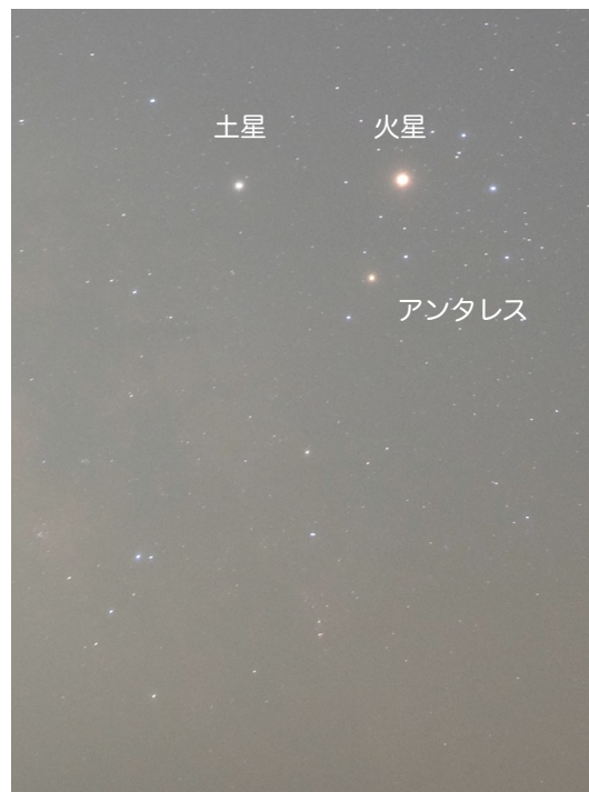
写真1 さそり座と火星、土星 2016/5/4 1:13、たつの市新舞子にて

地球と火星はおおよそ2年2ヶ月ごとに接近します。接近時の軌道上の位置により接近距離も毎回変わり、今回よりも火星の近日点に近い、次回（2018年7月27日）の方がより接近します。火星も接近ごとに観察すると、変化が楽しめますよ。