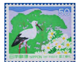
写真3 1994年国土緑化切手 左から 兵庫県木クスノキ、県鳥コウノトリ、 県花ノジギク

以上、野生ギクの特徴を簡単に説明してきましたが、今一番懸念されているのは野生ギクの保全の問題です。野生ギクは、前述のように、冬の間「ロゼット」いう形で過ごします。このため、冬の間も十分な光が必要です。しかし、多くの生育地では、冬の間草刈りが行われなくなったために、他の植物がロゼットを覆ってしまい、生育に必要な光が確保できなくなっています。また、野生ギクの生育地周辺に植栽された栽培ギクの花粉が昆虫によって運ばれ、栽培ギクと野生ギクの雑種ができています。兵庫県の県花でもある「ノジギク」(写真3)の生育地でも、雑種の存在が確認されています。ノジギクと栽培ギクとの雑種は頭状花の大きさが野生のノジギクより大きく、観賞用として家の庭等に移植されることもあります。このようなことが繰り返されることによって、野生ギクの生育地がますます狭められていくことになります。