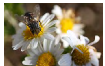
写真1 ノジキクとハナアブ (姫路市大塩町福泊海岸)