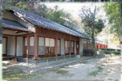
竹林に囲まれて ひっそりと佇む和室

静かな書写の山麓に建つ、「書写の里・美術工芸館」。その一角、竹林に囲まれた『和室(交流庵)』があります。お茶会や句会、簡易な展示会など、さまざまな文化活動の場として施設使用(貸室利用)できます。皆様のご利用をお待ちしています。