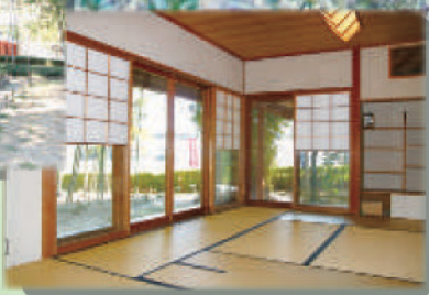
日頃の文化活動の成果を発表する場として利用されています