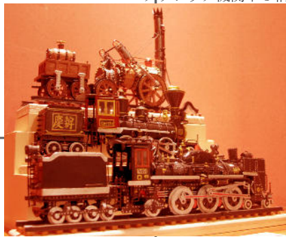
クラシック機関車3輛