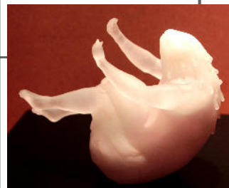
To be in the water