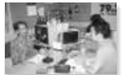
身近な話題を提供

インフォメーション・ギャラリー 日曜日 12:45～12:55 18:30～18:40(再)