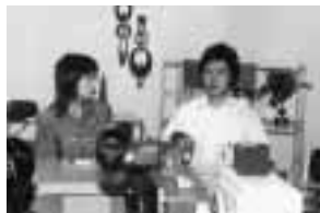
市のイベントや話題などを紹介