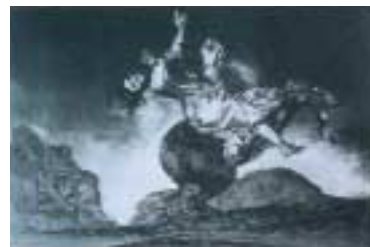
「ロス・デイスバラティスより「誘拐する馬」」