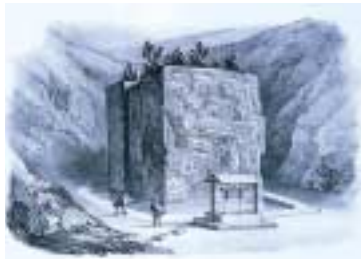
「シボルト「日本」より「石の宝殿」」