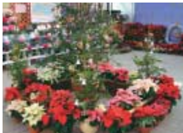
クリスマスでおなじ みのポインセチア