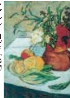
シャルル・コッテ「静物」