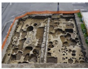
姫路城城下町跡第452次▶

目覚ましい成果を上げてきた発掘調査の中から、令和3・4年度を中心に最新情報を選びすぐって紹介します。