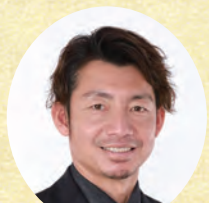
姫路大名行列「殿様役」 元プロ野球選手 鳥谷 敬さん