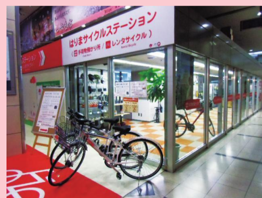
姫路駅前サイクルステーション

※ご来場はなるべく公共交通機関をご利用ください。 お車でご来場の場合、近隣の有料駐車場をご利用ください。