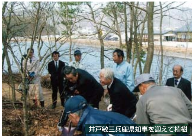
井戸敏三兵庫県知事を迎えて植樹

三月二十一日春分の日、「ゆたりんふれあいまつり」と「里山開き」の開山式が盛大に行われました。参加人数は約九百名。前日は春の嵐と黄砂で準備が大変でしたが、当日は風も収まり、ま