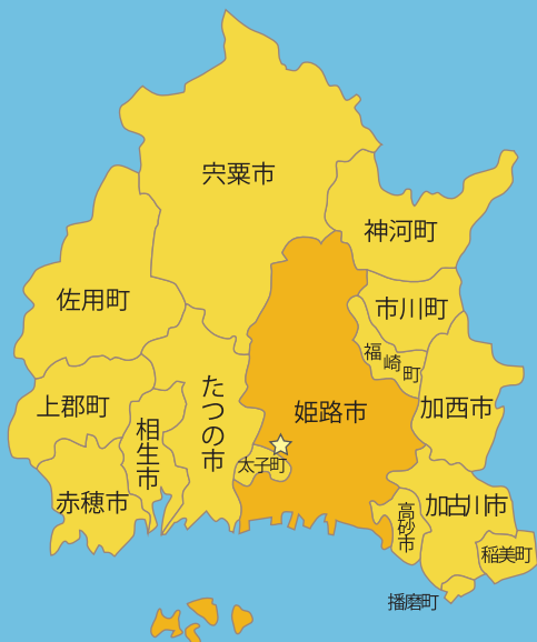
播磨圏域連携中枢都市圏（8市8町）