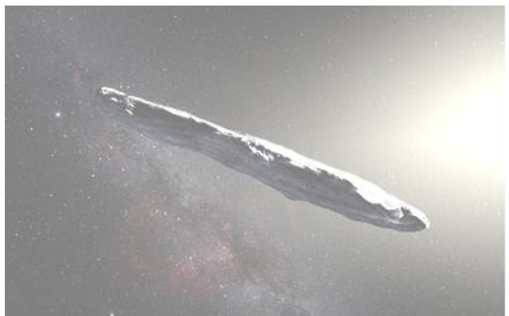
図2 オウムアムアの想像図。小さな天体で遠距離だったため観測では点像にしか写らず、細長い形状は明るさの変化から推定された。

オウムアムアは多くの謎を残したまま太陽系を去りつつあり、もはや遠ざかりすぎて追加の観測もできません。オウムアムアに残された多くの謎を解くためにも、次の太陽系外天体（2I/・・・）の来訪と発見が待たれます。