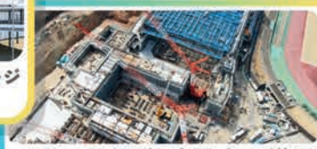
アリーナ姫路 建設中の様子 建物の内部にも鉄が活躍！