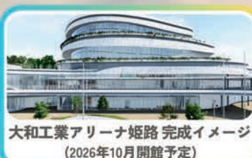
大和工業アリーナ姫路 完成イメージ (2026年10月開館予定)