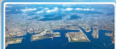
播磨臨海地域の製鉄所群 (日本製鉄株式会社 瀬戸内製鉄所 広畑地区)