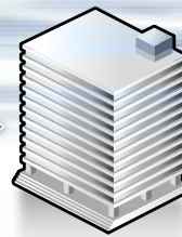
経済産業省 産業保安監督部長

http://www.meti.go.jp/policy/safety_security/industrial_safety/links/kantokubu.html