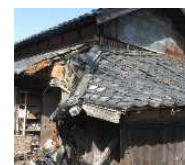
緊急代執行を要する 崩落しかけた屋根