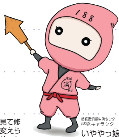
姫路市消費生活センター 啓発キャラクター いややっ娘