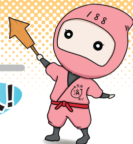
姫路市消費生活センター 啓発キャラクター いややっ娘

成年年齢引き下げによる、18歳～19歳の若者の消費者被害の拡大が懸念されています。「契約」を安易に考えず、正しい知識を持って悪質商法などにだまされないようにしましょう。