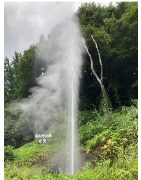
【鬼首かんけつ泉：宮城県】

香寺公民館で46講座、香寺北公民館で12講座が開設されています。詳しくは、香寺公民館にあります「文化講座のご案内」をご覧ください。