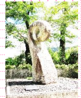
「石になったゼンマイ」