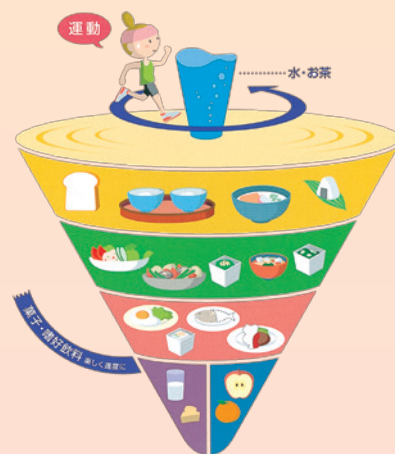
食事バランスガイド