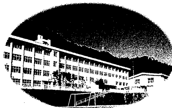
後期課程棟 (中学校校舎)