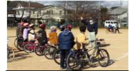
自転車の点検方法を学ぶ