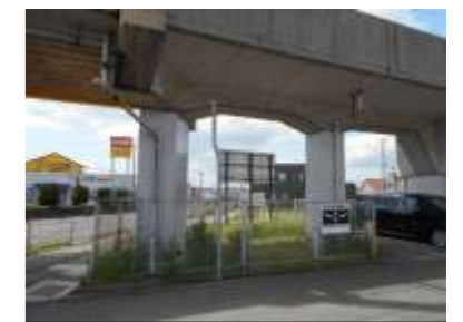
高架橋耐震対策 （山陽電鉄網干線 飾磨～西飾磨駅）