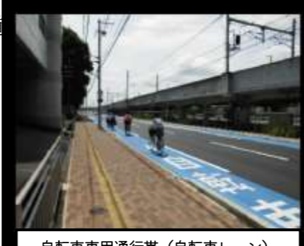
自転車専用通行帯（自転車レーン） （市道幹第22号線・姫路市西延末）