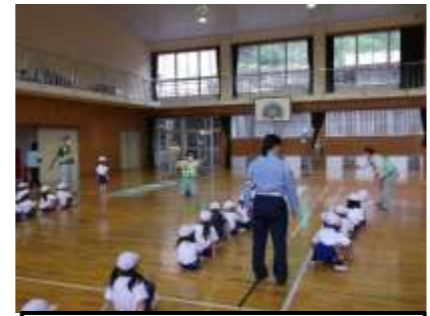
交通安全教育の実施 小学1年生「道路の安全な渡り方」