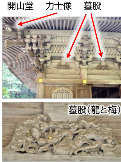
圓教寺の指定等文化財一覧

開山堂は 圓教寺開山の性空上人をまつる堂で、灯明が燃え続け朝夕欠かさず勤行がおこなわれている。軒下の四隅に左甚五郎作と伝えられる力士の彫刻や、屋根の加重を分散するために梁に設置された墓股(かえる また 東西南北と境に合計21設置され、“龍と梅”“琴高仙人”などが彫刻されている)について詳しい説明を受けた。西北隅の力士は重さに耐えかねて逃げ出したと言う伝説は有名。