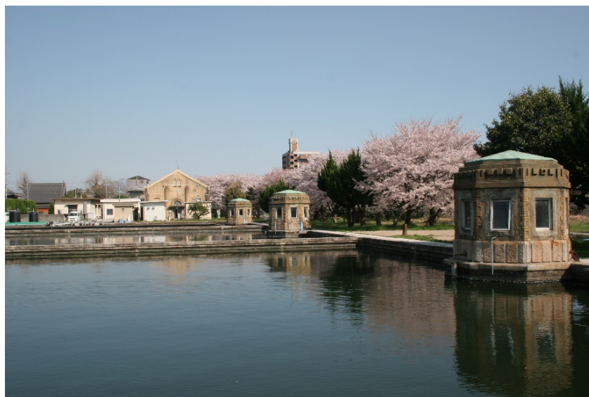
町裏浄水場 昭和4年に給水を開始した姫路市最初の浄水場 国宝姫路城近くに位置し、レトロな建築物が残る 日本の近代土木遺産 2800 選、日本水道百選