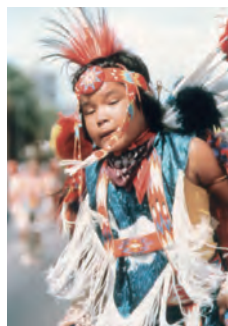
先住民の伝統文化

気候温暖で大気清澄、年間 300 日を超える快晴に恵まれ、『太陽の溪谷』と呼ばれる米国随一の観光・保養地です。