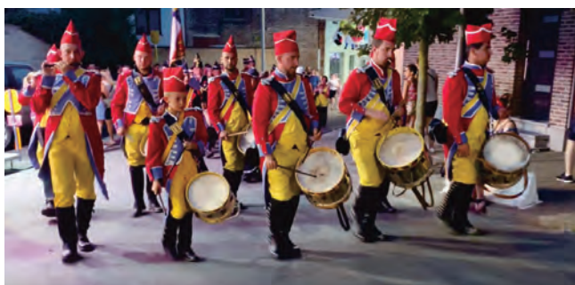
マドレーヌの行進