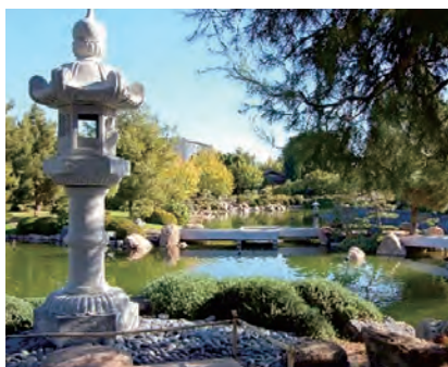
姉妹庭園「驚鳳園(らほうえん)」