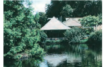
アデレード・姫路庭園 水の映える美しい日本庭園です。