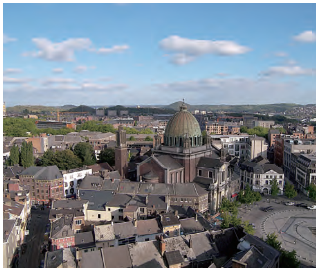
シャルルロア市街