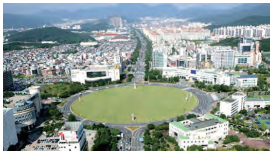
昌原市役所前広場

姫路市は、旧・馬山市と姉妹都市提携しましたが、2010年7月、周辺2市と合併して誕生した新・昌原市と姉妹都市交流を継続しています。