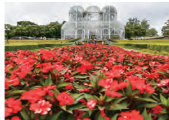
クリチーバ植物園

近年、市民の住みよさを追求する都市計画を積極的に進め、バスを主要交通機関とするなど、その都市計画は世界的にも高い評価を得ています。また、自然保護活動や刷新的なゴミ処理により、良好な自然環境が保たれており、環境にやさしい都市としても知られています。