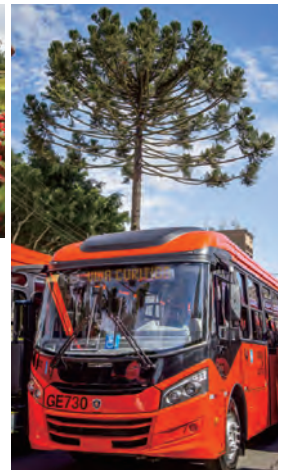
クリチーバ市営連結バスと パラナ州のシンボル・パラナ松