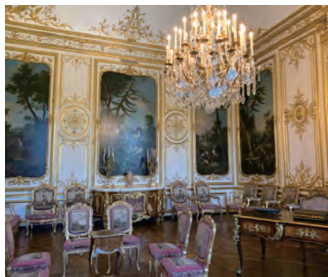
シャンティイ城内コンデ公寝室