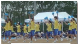
一致団結の応援合戦