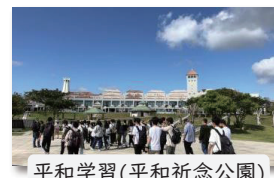
平和学習(平和祈念公園)