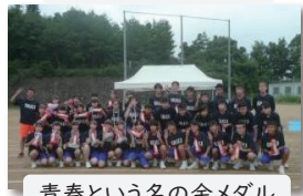
青春という名の金メダル