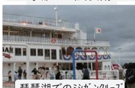
琵琶湖でのミシガソルズ