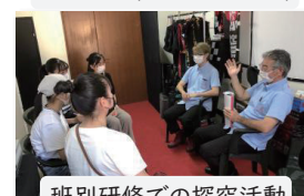
班別研修での探究活動