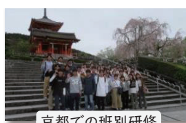
京都での班別研修