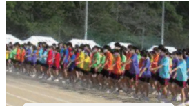
お揃いのクラスTシャツ