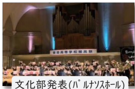
文化部発表(パルナソスホール)