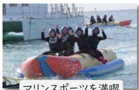
マリンスポーツを満喫