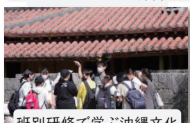
班別研修で学ぶ沖縄文化