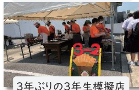
3年ぶりの3年生模擬店