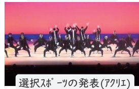
選択スポーツの発表(アクリエ)