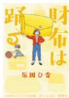
「財布は踊る」 原田ひ香著 (新潮社)