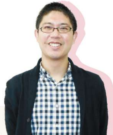
神戸新聞社姫路本社 編集部記者

こうした中、広告業界では2020年にUN Women(国連女性機関)が主導するアンステレオタイプアライアンス日本支部が設立され、メディアや広告の力でジェンダー平等を推進し、ステレオタイプ(固定観念)を撤廃する取り組みを始めました。新聞業界でも2022年に現役新聞記者たちによる「失敗しないためのジェンダー表現ガイドブック」(小学館)が発刊されるなど、議論が行われています。