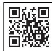
新冠疫苗接种 导航网二维码