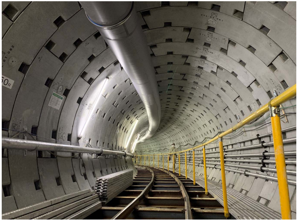
シールド坑内のR=60m 急曲線部分 規則正しく並ぶ穴はボルトを締めるためのもの 最後にモルタルを充填して仕上げます