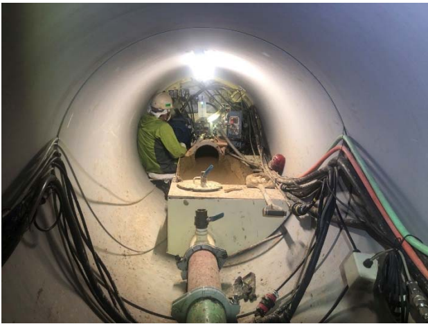
φ1350 推進の内部 狭いのが伝わるでしょうか

をコントロールします。排出された土砂はバキュームで吸引されて、配管の中を運ばれます。このバキュームは超強力。一家に1台にあると掃除がはかどるかも?!