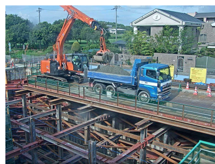
【掘削・土留め支保工】