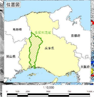
揖保川水系 洪水浸水想定区域図 浸水継続時間【14/28】