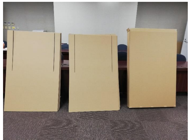
仕切り板（パーティション）部品一式