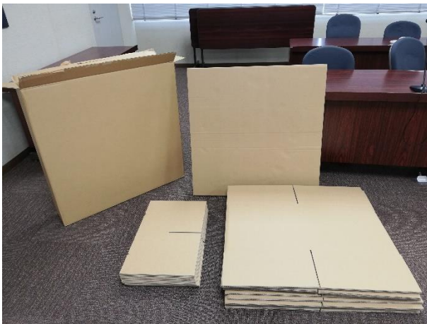
段ボールベッド部品一式