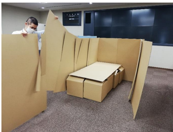
段ボールベッド及び仕切り板の組み立て