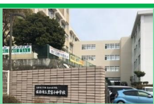
本館と南館をつなぐ渡り廊下

豊富小中学校はICTの活用を含む多様な手段により、子供の学びを保障すると同時に、心のケアにも取り組んできました。