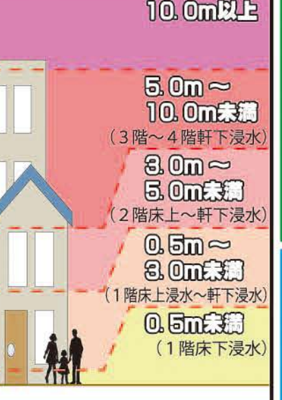
洪水浸水深想定範囲