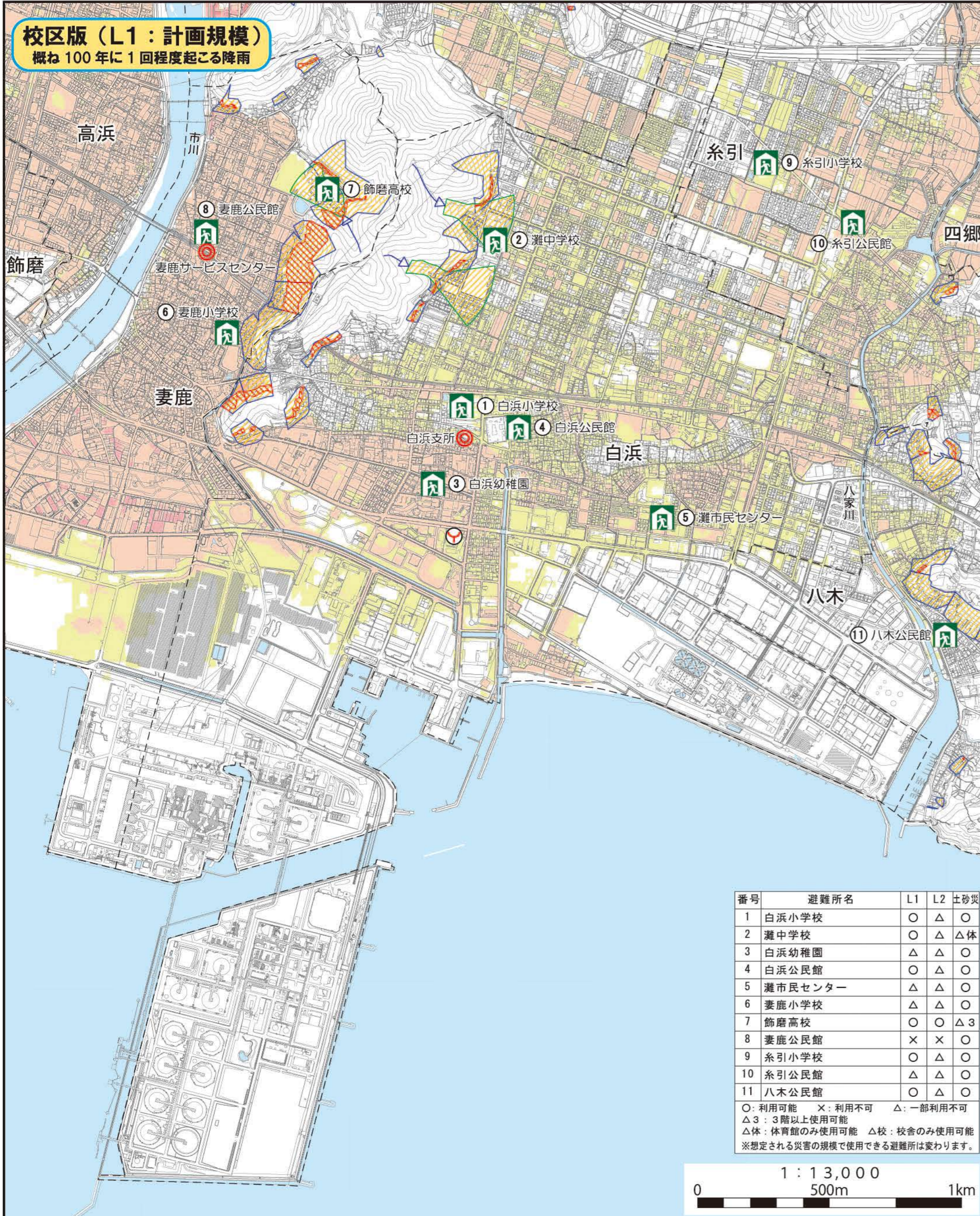
校区版（L1：計画規模） 概ね100年に1回程度起こる降雨

この洪水・土砂災害ハザードマップは、洪水・土砂災害による被害を予測し、その範囲を地図に示したものです。 洪水については、浸水が想定される区域とその水深の情報を記載しています。お住いの地域を中心に、校区版のマップには河川整備の目標としている降雨（L1：計画規模降雨＝概ね100年に1回程度起こる降雨）により河川が氾濫した場合の浸水想定区域を表示し、広域版のマップには想定し得る最大規模の降雨（L2：想定最大規模降雨＝概ね1,000年に1回程度起こる降雨）により河川が氾濫した場合の浸水想定区域を表示しています。 土砂災害については、兵庫県が「土砂災害警戒区域等における土砂災害防止対策の推進に関する法律」に基づき、土砂災害のおそれのある区域を調査し、指定した土砂災害警戒区域及び土砂災害特別警戒区域を表示しています。 自宅等の危険度を事前に把握いただき、避難行動に役立ててください。