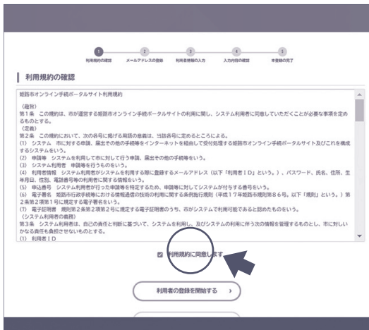
③ 利用規約を確認し、チェックを入れて「登録を開始する」を押す。