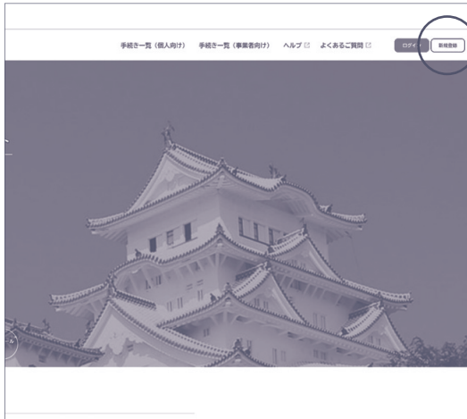
① 新規登録をクリックする。