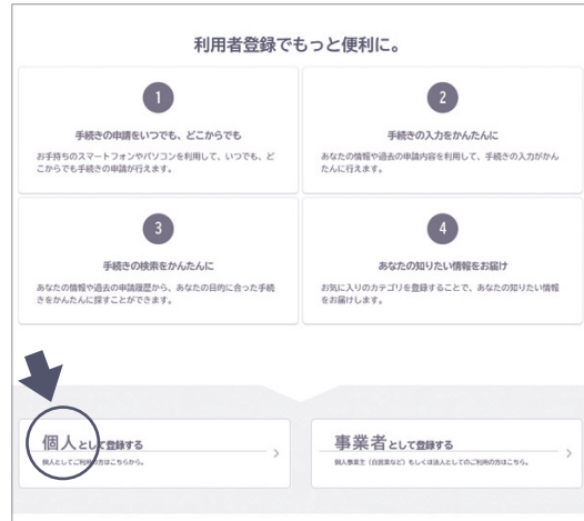
② 「個人として登録する」を選ぶ。