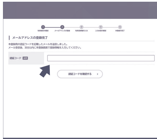
⑤ 任意のメールアドレスを入力し、登録すると自動返信メールで「認証コード」が送られる。認証コードが届いたら次の画面で30分以内に入力してください。(メールが届かない場合は再度やり直さずか、メールアドレスの変更など受信できるアドレスの確認をしてください)