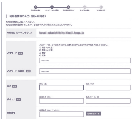
⑥ 認証コードを入力しましたら個人の登録をしてください。利用者ID(メールアドレス)とパスワードは予約画面でも使いますので、必ずメモを取ってください。