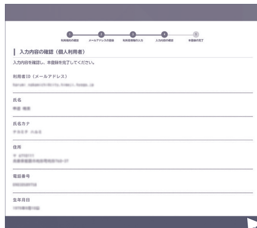
⑦ 登録します。よろしいですか? [OK] を選ぶ。