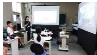
遠隔授業により「リモート句会」に取り組む様子

他校の児童と、あたかも同じ空間にいるように一緒に学習する機会をもつことができた。画面の向こうにいる新たな仲間と、時間や意見を共有できたことは、大変有意義な取組だった。