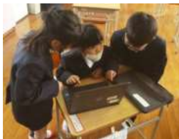
学年を越えた学び合い

授業や行事の活用も進み、特に「表現活動発表会」では、高学年が自分たちの演技を録画し、相互評価に活用した。歌あり踊りありの音楽劇において、自分たちで課題を見つけて話し合い、表現の工夫を高めることができた。