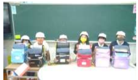
1年生 初めての持ち帰り

Chromebookの持ち帰りは、学校から提示された課題以外にも児童が自ら課題を選択し解決したり、ドリル学習ソフトなどを用いて個々のペースで学習したりして、学習意欲や基礎学力を高めることを目指して実施している。