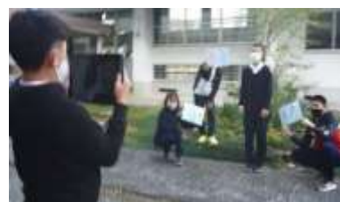
「ふるさと苜野」を PR するための CM づくりに取り組む様子

ふるさと苜野を、もっとよいまちにするために自分たちにできることはないかと考え、地域や地域以外の方々に PR する取組を進めた。苜野のよさをスライドにまとめたり、Screencastify を使って CM 制作に取り組んだりした。ICT の活用により、主体的に考え、話し合っ