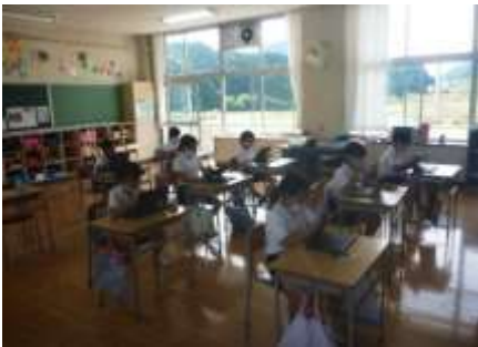
2年生の学びタイムの様子

5月下旬、新型コロナウイルスによる臨時休業中の登校日から、1人1台Chromebookの取組が始まった。