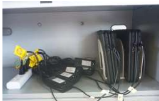
教室の電子黒板のロッカー

7月、教室の電子黒板下のロッカーに、ACアダプターを入れて Chromebook を保管することにした。保管や持ち出しのルールを決めて、児童が自由に Chromebook を持ち出せるようにした。自由に使えるようになってしばらくの間は、高学年を中心に休み時間にゲームをする光景が見られたが、担任が1日1回は外に出るようにと誘うことで目立たなくなった。朝登校したら、自分で Chromebook を出して、お気に入りのウェブサイトを探したり、朝学習などに取り組んだりする姿も見られるようになった。