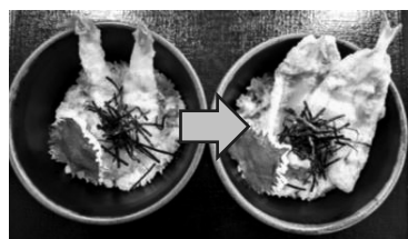
左→えび天井 右→きす天井