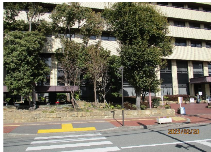
敷地南側から北を望む (①)