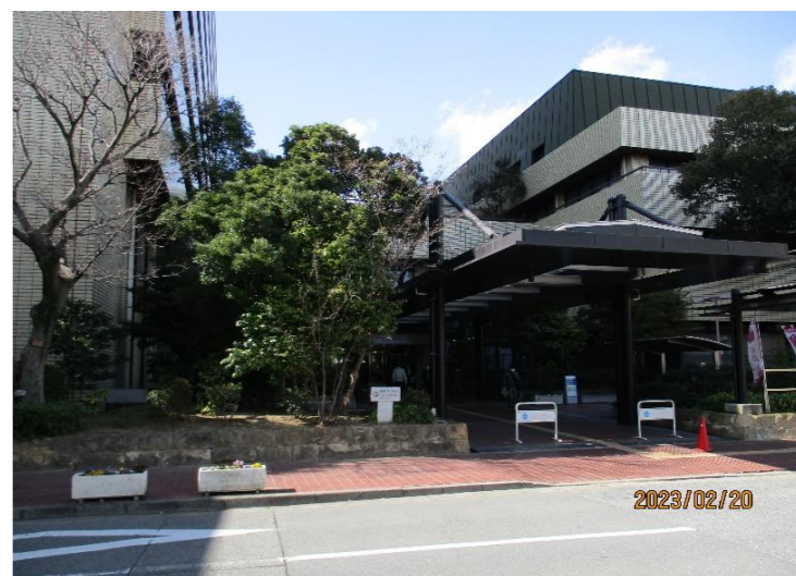
敷地東側から西を望む (②)