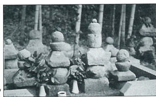
太尾一族の墓所といわれる