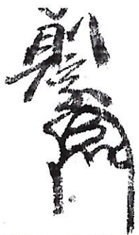
246 浦上 則宗