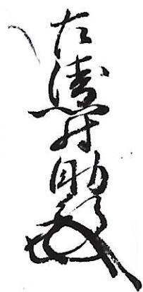
404 小河 助行