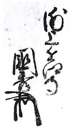
199 浦上 国秀