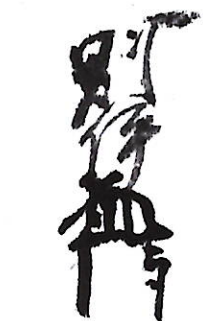
426 櫛橋 則伊