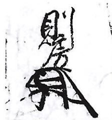
185 赤松 則房