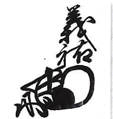
184 赤松 義祐