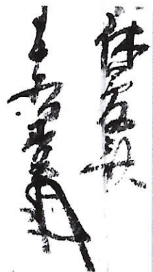
208 小寺 休夢 (善慶)