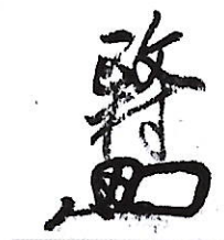
491 赤松 政村