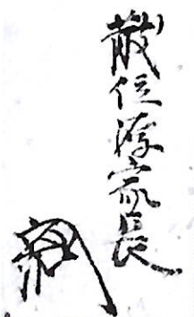
334 広峯 家長