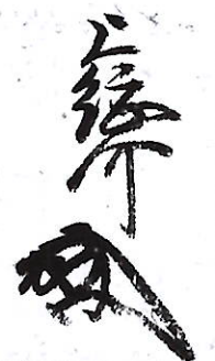
303 赤松 義則