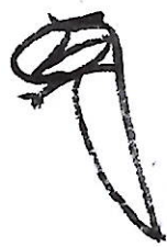
342 山名 政豊