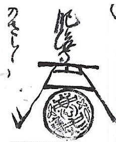
63 木下 家定