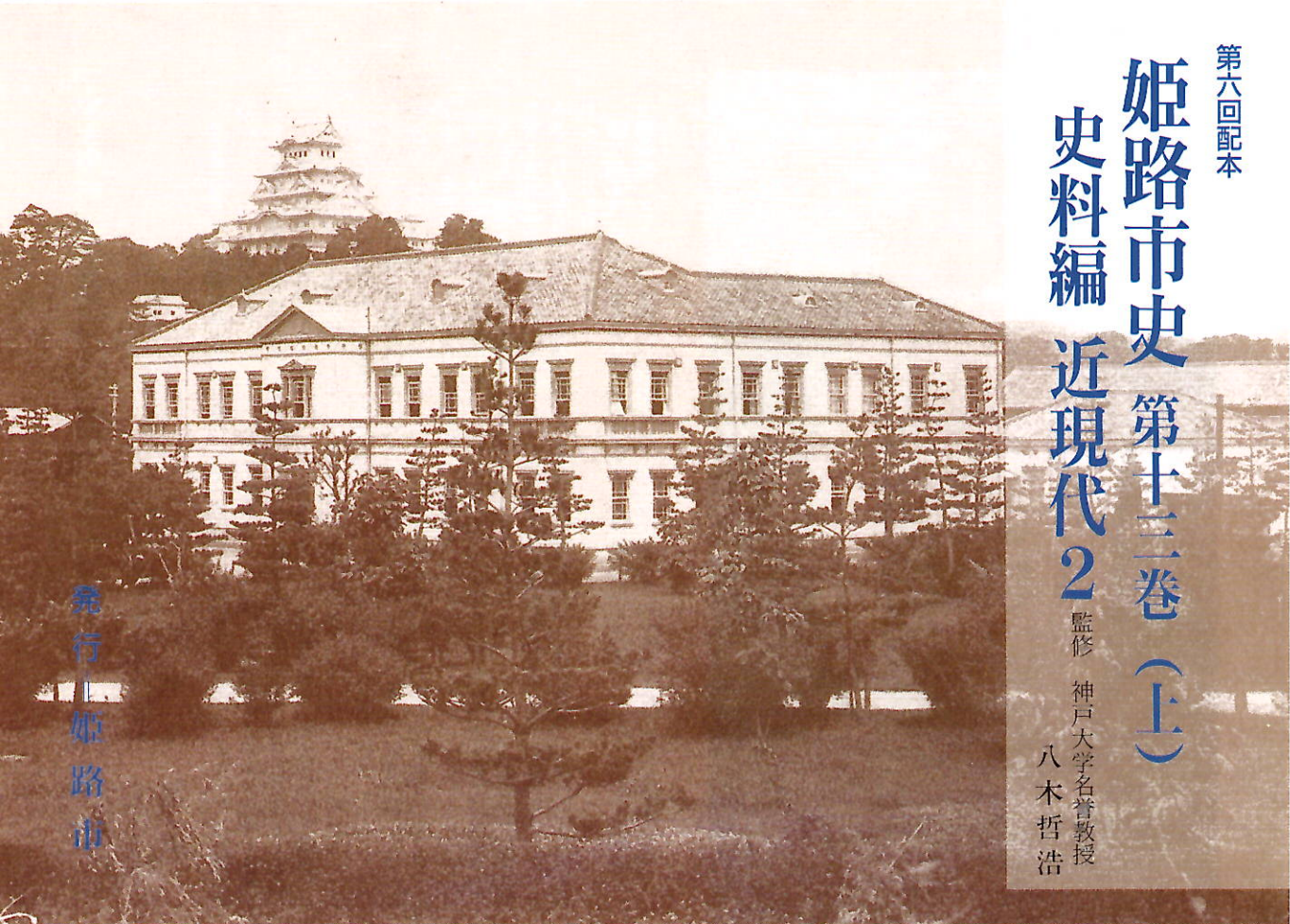
(内京口門内にあった第十師団司令部)