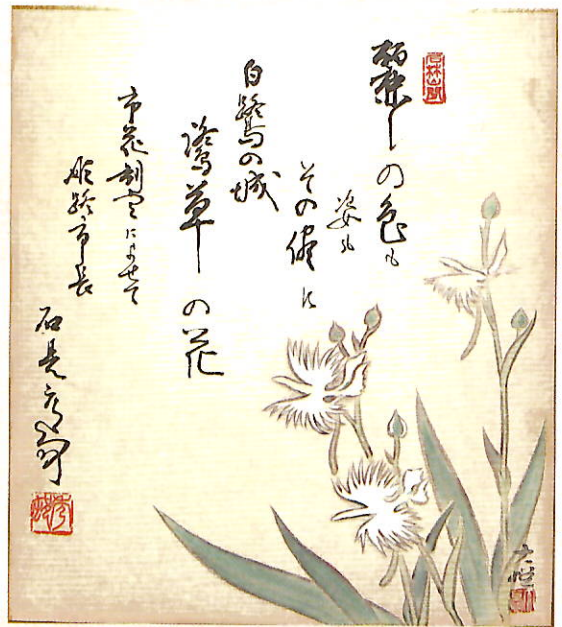
石見元秀筆 菖蒲大悦画による市花しらさぎ草 市史編集室所蔵