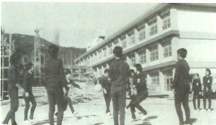
校舎の鉄筋化が進む高丘中学校 『姫路市勢要覧 1970年版』