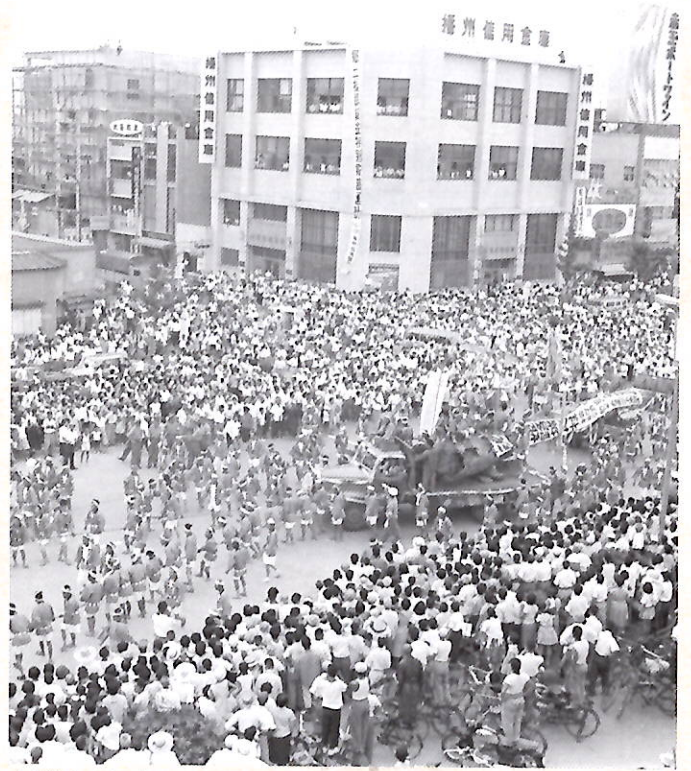
大手前通りを行く姫路城大天守心柱 姫路市立城郭研究所蔵