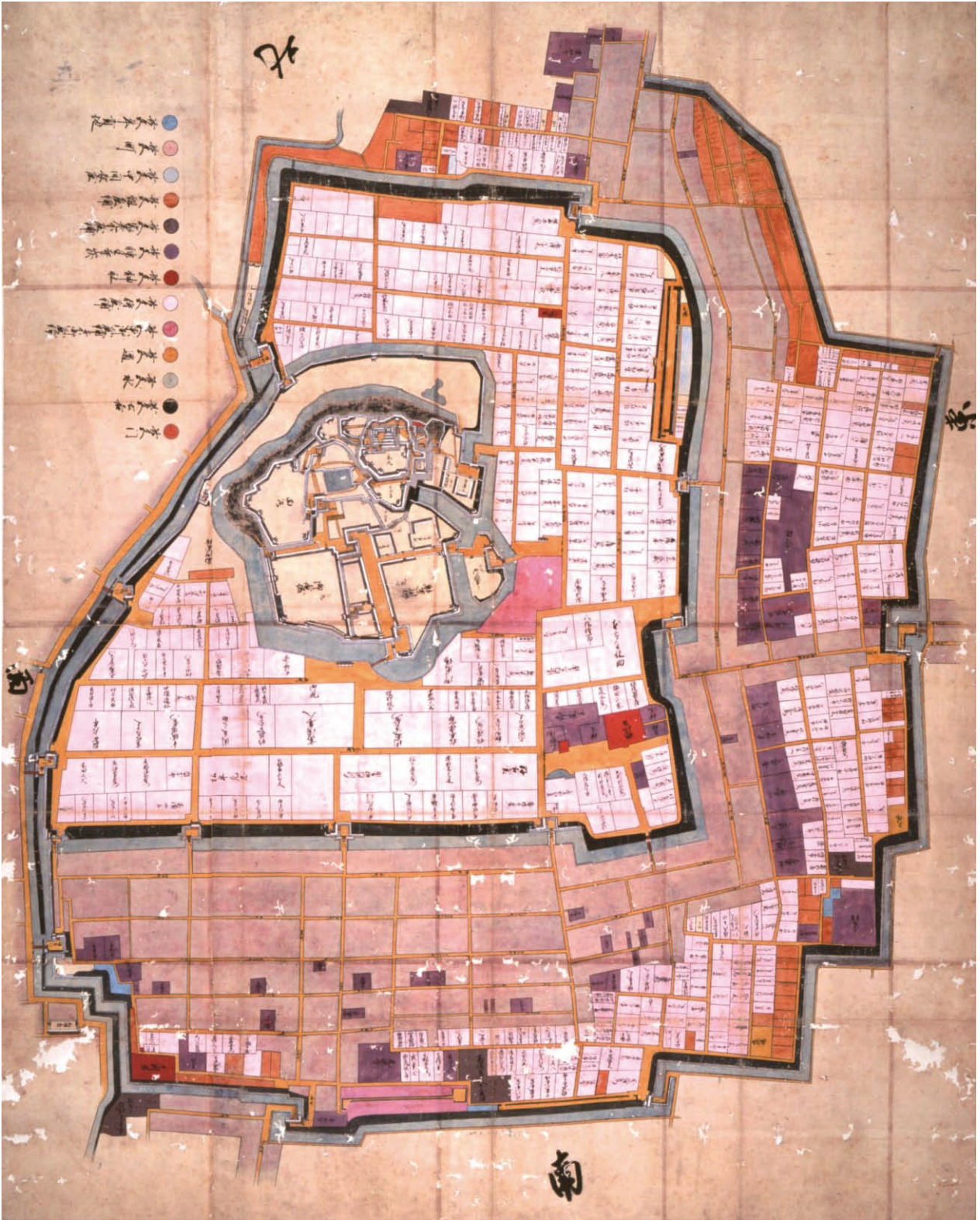
酒井家時代の絵図（姫路侍屋敷図：文化13年（1816年）以前）