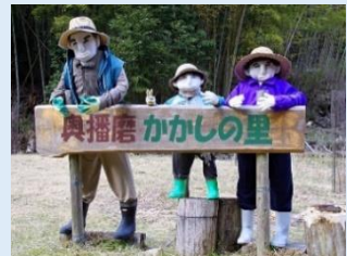
⑤ 奥播磨かかしの里

関集落に、山村の情景に合った「かかし」が随所に配置されており、多くの人々が訪れている。