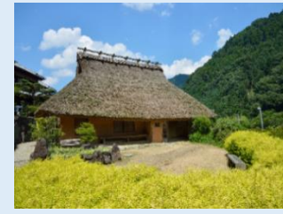
⑧ 古井家住宅(千年家)

治水を目的とした重力式コンクリートダム。四季折々の修景を楽しみながら外周を散策できる。