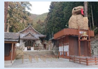
⑨ 加茂神社・安志稲荷神社

京都賀茂別雷神社(上賀茂神社)の荘園、安志庄の総社として建立された神社。家内安全・商売繁盛のご利益で知られて