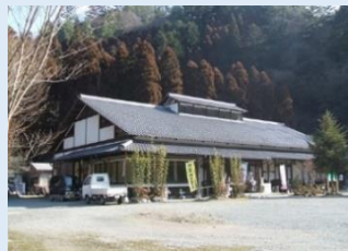
④ 鹿ヶ壺キャンプフィールド

四季折々にその姿を変える山々と清流に囲まれ、コテージ、キャンプ場、バーベキューサイト等も備えた施設。