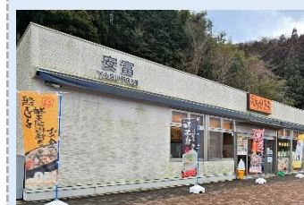
⑫ 安富パーキングエリア

安富町三森にある中国自動車道上にあるパーキングエリアで安富産ゆずを使った料理が食べられる。