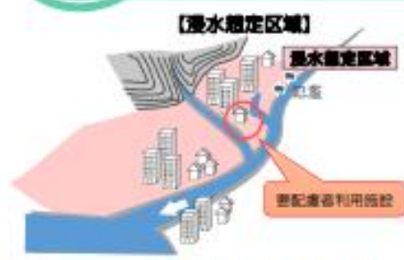
※「浸水想定区域」とは、洪水・雨水出水・高潮により浸水が想定される区域であり、国または都道府県が指定します。