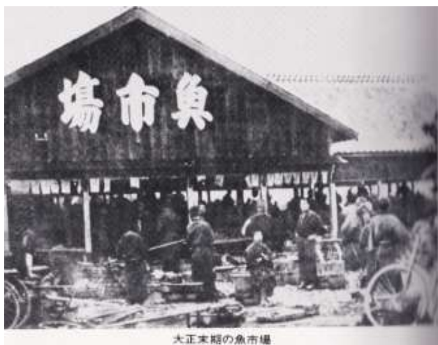
大正末期の魚市場