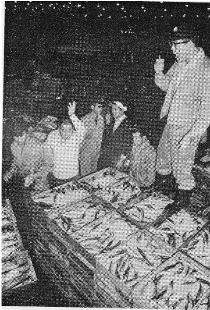
早朝せり（中央市場）

妻鹿といえば、かつては漁港と魚市場で近隣に知られた土地柄でした。しかし、時代の流れの中で漁業は衰退し、魚市場も手柄の中央市場へ、そして、今は最新鋭の中央市場が白浜町に開業稼働しています。灘中学校の「創立25周年記念誌」に魚市場が賑わっていた頃の“鮮魚問屋の商標”が掲載されています。